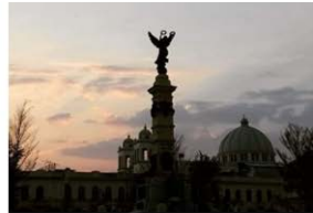
6. Plaza La Libertad, San Salvador