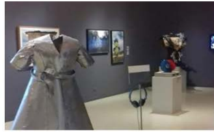
7. MARTE, San Salvador