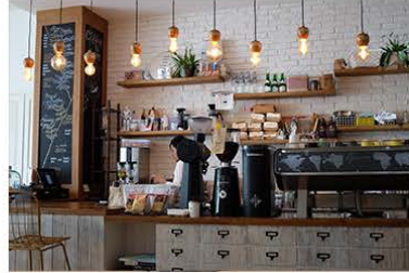
Café / Coffee shop