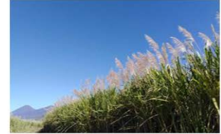
4. San Julián, Sonsonate