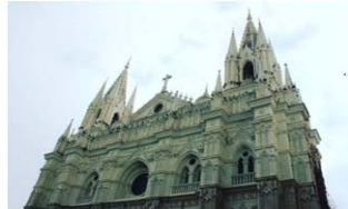
3. Catedral de Santa Ana, Santa Ana