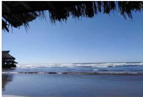
5. El Jaguey, La Unión