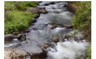
8. Rio Chiquito, Chalatenango