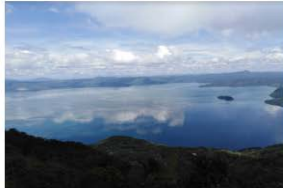
2. Ilopango, San Salvador