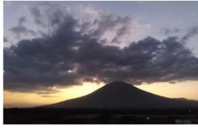
1. Chaparrastique, San Miguel

Look at the following Salvadorian tourist attractions. Write their names in your notebook.